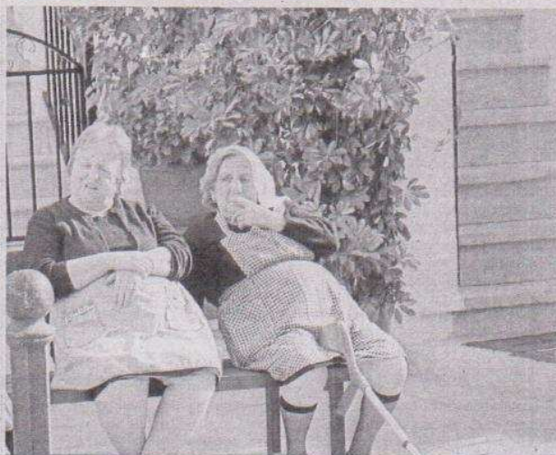
Varios vecinos conversan en un banco del centro del municipio.