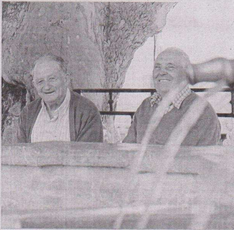
La Fuente de los Dieciséis caños es lugar de encuentro de muchos habitantes de la localidad.

Un pueblo que crece cada día manteniendo las tradiciones que le dan su identidad.